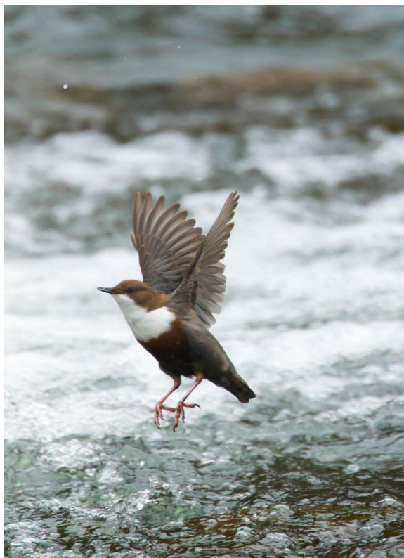
Wasserramsel (Cinclus cinclus)